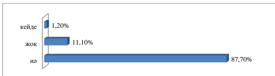
Сурет 2 - Мектептегі кәсіптік бағдар беру жұмыстарының маңыздылығы

«Сіз мектепте кәсіптік бағдар жұмыстарын жүргізу маңызды деп санайсыз ба?» деген сұраққа оқушылар келесідей пікір қалдырды: оқушылардың 87,7% - ы «иә», 11,1% - ы «жоқ», ал қалған 1,2% - ы «кейде» деп жауап берді.