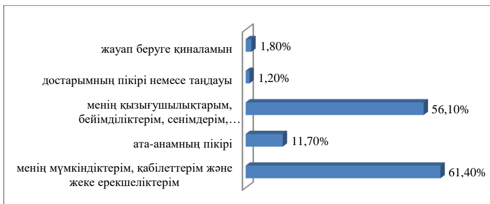
Сурет 3 - Оқушылардың пікірі бойынша болашақ мамандығын таңдауға әсер ететін факторлар

«Менің болашақ мамандығымды таңдауға әсер етеді» деген сұраққа келесі жауаптар алынды: менің мүмкіндіктерім, қабілеттерім және жеке ерекшеліктерім - 61,4%; ата-анамның пікірі-11,7%; менің қызығушылықтарым, бейімділіктерім, сенімдерім, құндылықтарым-56,1%; достарымның пікірі немесе таңдауы - 1,2%; жауап беруге қиналамын-1,8%. Алынған жауаптардан көріп отырғанымыздай, оқушылардың болашақ мамандығын таңдауға ата-аналардың пікірі әсер етеді. Сондықтан кәсіптік бағдар процесінде оқушылардың тек өздерімен ғана емес, ата-аналарымен де ағартушылық жұмыстың назардан тыс қалдырылмауы маңызды.