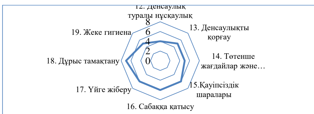
Сурет 2 - Денсаулық және қауіпсіздік шкала көрсеткіштері

Зерттеу барысында психологиялық-педагогикалық бағыттың кәсіби қызметін ұйымдастыру дайындығына ерекше көңіл бөлінді. Осы тұрғыда, болашақ педагог-психологтердің кәсіби құзыреттілігін қалыптастыруда олардың мектеп оқушыларымен жұмыстарын дамыту қажет. Сондықтан, болашақ мамандар 2023-2024 оқу жылы Алматы қаласының бірнеше мектептерінде SACERS халықаралық өлшем шкалалары бойынша өткізіліп жатқан арнайы экспериментке қатысты. ЖББМ №19 мектепте жүзеге асырылған экспериментте болашақ педагог-психологтер мектептің білім беру ортасын, соның ішінде оқушылардың Soft skills аясындағы жеке, әлеуметтік, танымдық, сандық, коммуникативтік қабілеттері мен құзыреттіліктерінің, қарым-қатынастың дамуын, қоршаған ортаны, оқыту процесін ақпараттық-техникалық жабдықтармен қамтамасыздандыруын, білім беру мекемесінің инфраструктурасын, т.б. жақтарын зерттеді. Эксперименттік жұмыстың нәтижесі келесі график арқылы жинақталды (1, 2, 3 суреттер )