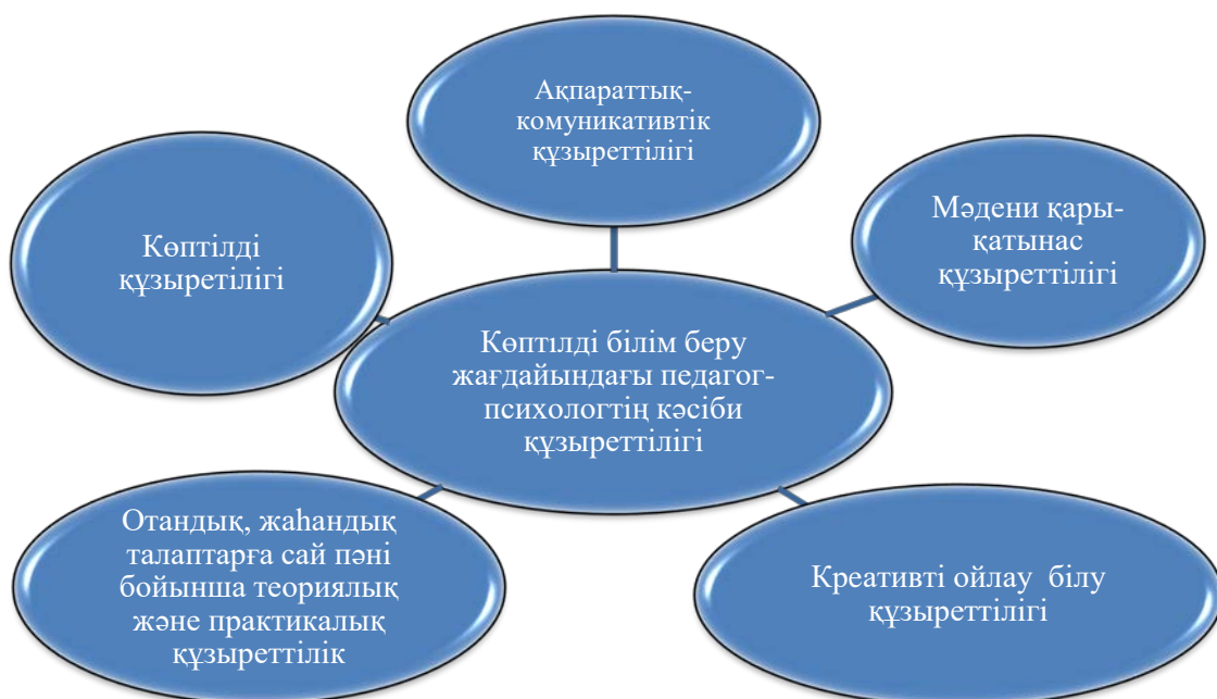
Сурет 1 -Болашақ педагог-психологтердің кәсіби құзыреттілігінің құрылымы (Т.Есімғалиеваның зерттеуі бойынша)

Бұл көптілді білім беру жағдайында, болашақ педагог-психологтердің кәсіби құзыреттілігі әлемдік проблемаларды, жаңа өмір салтын, мәдени әртүрлілікті, жаһандық ортамен тиімді қарым-қатынас жасау қабілетін анықтайды. Мұнда, ақпараттық сауаттылық, қоғам алдындағы азаматтық жауапкершілік және педагог-психологтердің кәсіби дайындығы білім беру саласындағы педагогикалық қызметті жүзеге асыруда көрінетін көрсеткіштер.