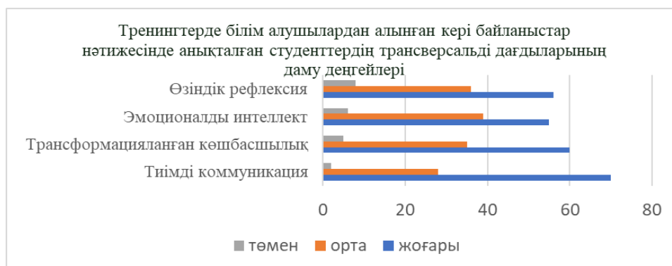
2-сурет. Тренингтерде алынған кері байланыстар бойынша білім алушылардағы трансверсальді дағдылардың даму деңгейлері

Біздің зерттеуімізде «Бастауышта оқытудың педагогикасы мен әдістемесі» мамандығы контекстінде студенттердің трансверсальді дағдыларын қалыптастыру үшін келесі әдістер пайдаланылды: негізгі пәндерге кіріктіре меңгерту, коллаборативті оқыту және білім алушылардың өз бетімен жұмыстарына берілетін тапсырмалар арқылы дамыту. Келесі суретте тренингтерде алынған кері байланыстар бойынша трансверсальді дағдылардың даму деңгейлері көрсетілген.