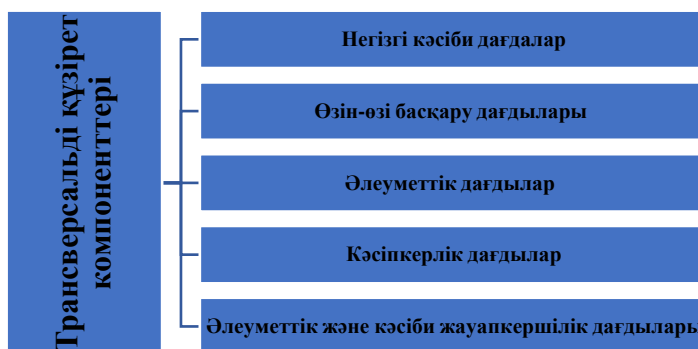
Сурет 1 – Трансверсальді құзыреттілік компоненттері

Ал, бесінші өлшем, әлеуметтік және кәсіби жауапкершілік дағдылары бәсекеге қабілетті адал және әлеуметтік жауапты тұлға қажеттілігімен байланысты. Бұл өлшем әлеуметтік жауапкершілікті ілгерілетуге және тұрақты даму мақсаттарына қол жеткізуге бағытталған.