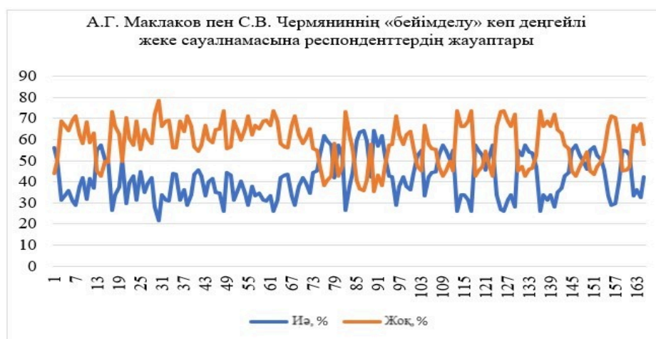
Сурет 2 – А.Г. Маклаков пен С.В. Чермяниннің «бейімделу» көп деңгейлі жеке сауалнамасына респонденттердің жауаптары

А.Г.Маклаков пен С. В. Чермяниннің «бейімделу» көп деңгейлі жеке сауалнамасының сұрақтарына алынған жауаптар сұрақтар санына сәйкес 163 жолдан тұратын кесте түрінде және оң және теріс жауаптармен байланысты екі баған түрінде ұсынылды. Нәтижесінде құрастырылған кесте деректері 2-суретте көрсетілген.