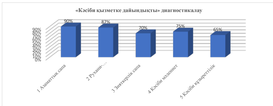
Сурет 3 – В. Андрееваның «Кәсіби қызметке дайындықты диагностикалау» әдістемесі

диагностикалау» әдістемесін және А.И.Юрьевтің «Адами капиталдың моделі» әдістемесін өткіздік. Байқылау кезеңінің нәтижесін 3,4 суреттерден байқауға болады.