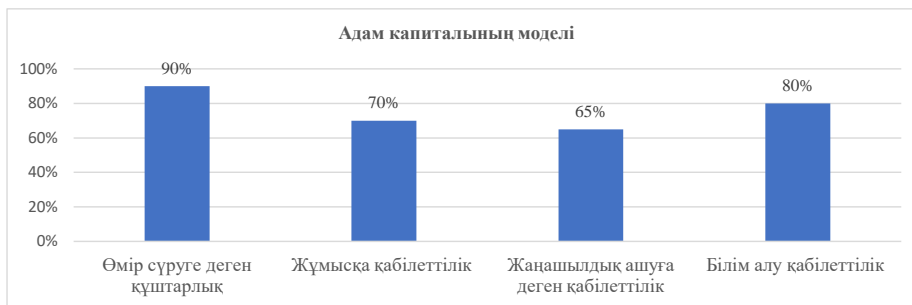
Сурет 4 – А.И. Юрьевтің «Адам капиталының моделі»

Бірінші әдістеменің нәтижесі айтарлықтай жоғарлағаның бірден бақауға болады, әрбір сапа 20-25% пайызға жоғарлағаны анықталды. Бұл әрине өте қуанышты жағдай себебі, студенттердің өздерінің мамандықтарына деген көз қарастары және жауапкершіліктерінің артқаның зерттеу жұмыстарының нәтижесінен аңғаруға болады.