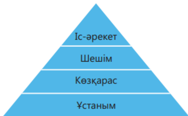
Сурет 1 – Мұғалім әрекетінің сатылай көрінісі.

Басқа пәндермен салыстырғанда әдебиетті оқыту үшін мұғалімге өзіндік ұстаным, мінез керек. Әдебиет тұтас ұлттың ұлтжанды ұрпағын қалыптастырушы пән екенін ескерсек, Ә.Бөкейханов айтқандай: «Ұлтқа қызмет ету – білімнен емес, мінезден» [7]. Ұлт көсемінің бұл пікірі шет елдік ғалымдардың да ойларымен ұштасады. Мұғалімнің ұстанымы оның көзқарасының қалыптасуына зор ықпал етеді, ал көзқарасы оның белгілі бір шешімдер қабылдауына, соның нәтижесіндегі сыныптағы іс-әрекеттеріне негіз болады.