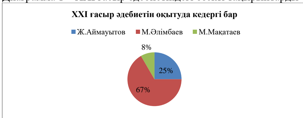
Диаграмма 2 – XXI ғасыр әдебиетін оқытудағы қиындық көрсеткіші