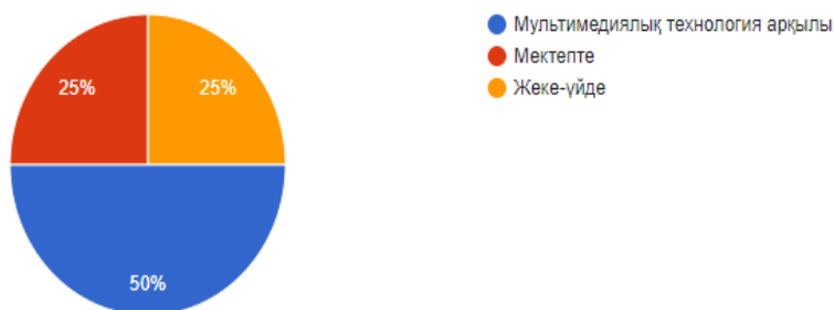
Сурет 2- Студенттердің мультимедиялық технологиялары арқылы шетел тілін үйренуі

Жауаптар бойынша, 66,7% жауап берген студенттер мультимедиялық технологиялар аудитивті құзыреттілікті дамыта алады деген пікірде