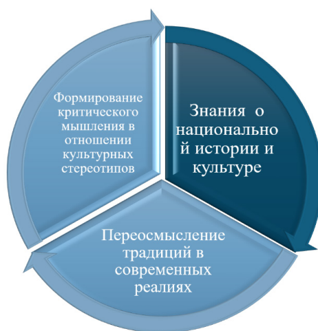
Рисунок 1 - Формирование мировоззрения молодежи через научные познания

ориентированное на исследования, помогает молодежи сочетать универсальные научные идеи с культурными ценностями, заложенными в казахских традициях, что приводит к более полной и актуальной идентичности. Развиваются важные когнитивные и социальные навыки, включая критическое мышление, аналитическую рефлекссию и способность работать в различных контекстах и в группах. Вышеуказанные навыки особенно ценны, ведь всегда необходимо находить баланс между глобальными культурными влияниями и своими национальными традициями или личными убеждениями. Рисунок 1 показывает, что научные исследования служат не только способом получения знаний, но и путём к культурной самореализации.