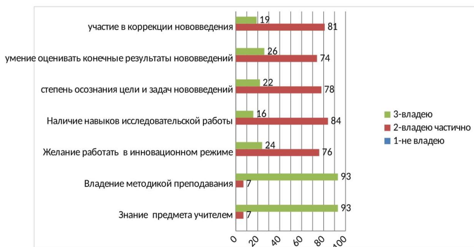
Рисунок 2. Анкета «Изучение профессиональной готовности педагога к инновационной работе».

готовы к преобразованиям своей деятельности, также никто из педагогов не отметил поле «не владею» (Рисунок 2).