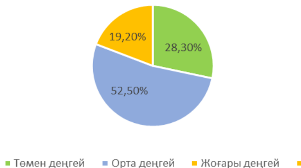
Сурет 1 – Студенттердің кәсіби рефлексия деңгейлері бойынша үлестірілу диаграммасы

1-суретте студенттердің кәсіби рефлексияның даму деңгейлері бойынша бөлінуін көрсететін диаграмма көрсетілген.