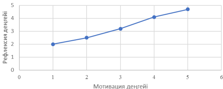
Сурет 2 – Студенттердің мотивация деңгейі мен кәсіби рефлексия деңгейінің өзара байланысы

Мотивация деңгейі мен кәсіби рефлексияның даму дәрежесі арасындағы өзара тәуелділік 2-суреттегі графикте бейнеленген. Деректер тұрақты үрдісті көрсетеді: мотивация жоғарылаған сайын рефлексиялық дағдылардың дамуы күшейеді, ал мотивациясы төмен студенттерде кәсіби рефлексия жеткіліксіз деңгейде қалады.