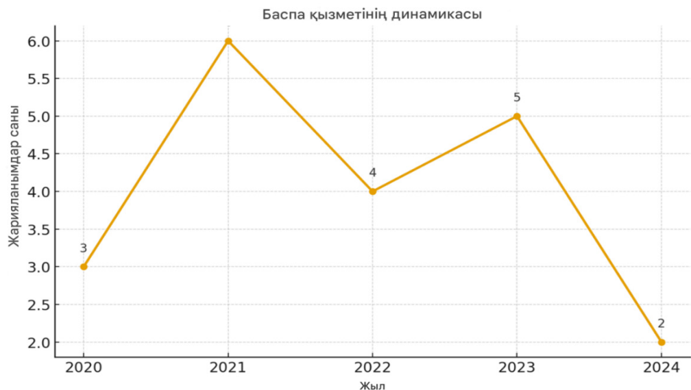
Сурет 2 - Басылымдар санының өсу тенденциясы

Жарияланым белсенділігінің динамикасы бойынша ең үлкен өсім 2021 жылы (6 мақала), содан кейін 2023 жылы (5 мақала) байқалды. Тұтастай алғанда, нейрожелілік технологияларының мүмкіндіктері кеңейген сайын және оларды педагогикалық білімге біріктірген кезде басылымдар санының тұрақты өсу тенденциясы байқалады (2-ші суретті қараңыз).