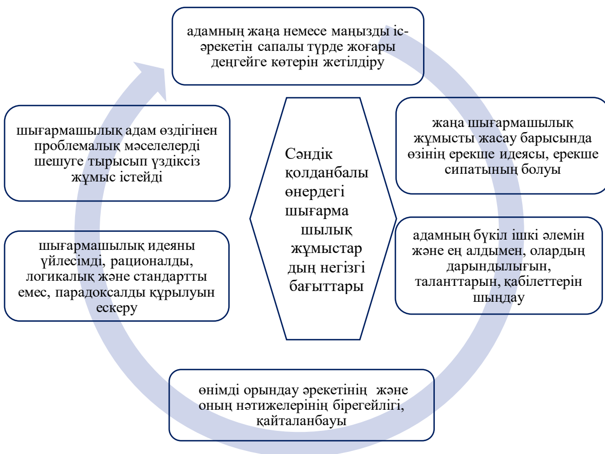
Сурет – 1. Шығармашылық жұмысты құрудың негізгі бағыттары.

Ұсынылған модельдің нәтижесі болашақ мамандарды сәндік-қолданбалы өнер іс-әрекетте өзін-өзі жүзеге асырудың жоғары деңгейіне көшуі болып табылады. Бұл жеке тұлғаның дамуына ықпал етеді: мотивтер өзгереді, жұмыс әдістері жақсарады, оған жауапты көзқарас қалыптасады, қажетті шығармашылық жұмыс қабілеті пайда болады, тақырыптың позициясы қалыптасады және тағы басқалар.