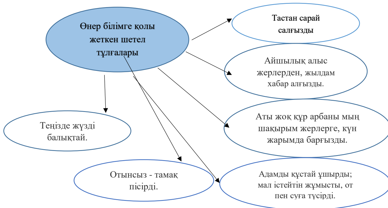
Сурет №1 Шетел оқымыстыларының жеткен жетістіктері